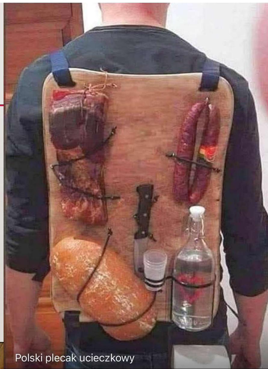
Polski plecak uciezkowy