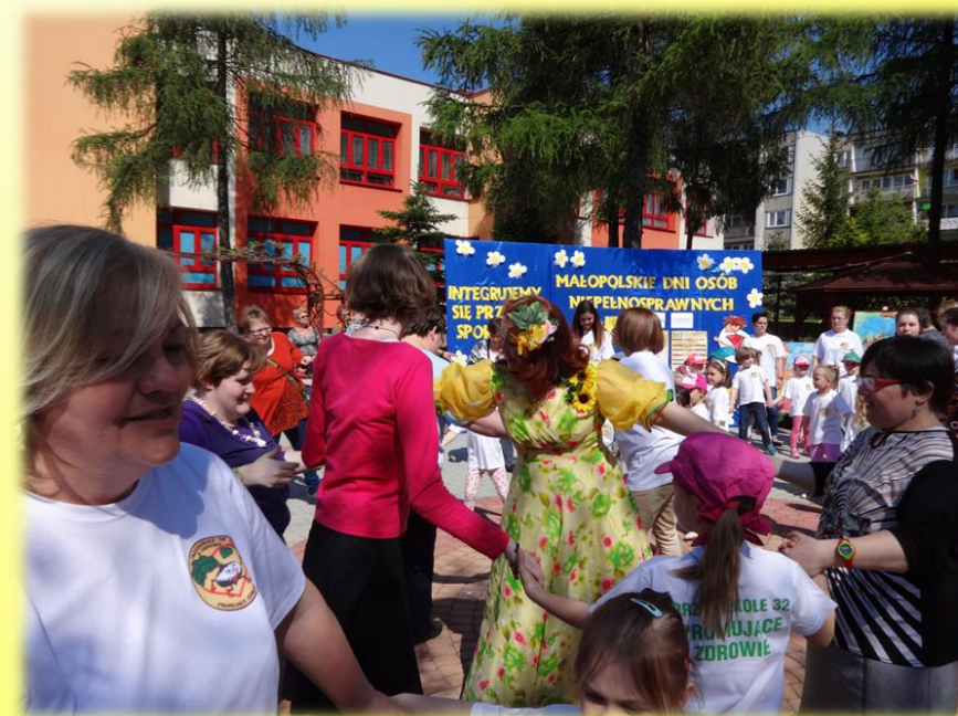
Małopolskie Dni Osób Niepełnosprawnych