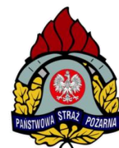
PAŃSTWOWA STRAŻ POŻARNA