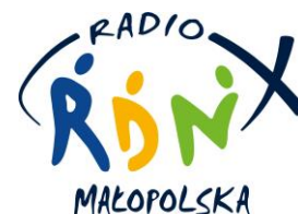
RADIO RDN MAŁOPOLSKA