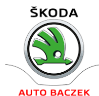
ŠKODA AUTO BĄCZEK