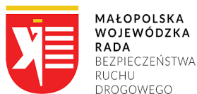
MAŁOPOLSKA WOJEWÓDZKA RADA BEZPIECZEŃSTWA RUCHU DROGOWEGO