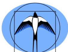
KURATORIUM OŚWIATY W KRAKOWIE