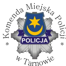
Komenda Miejska Policji w Tarnowie