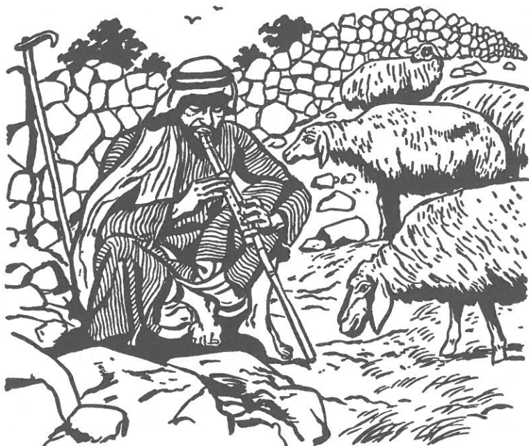
Pasterz grający na flecie

W ten sposób można też skłonić do powrotu zwierzę, które próbuje uciec. Właśnie używając procy, młody Dawid zabił Goliata (1 Sm 17,40-49). Usprawiedliwiając się przed Dawidem, Abigail rzekła: „niech dusza pana mojego będzie dobrze zamknięta w woreczku życia u Pana, Boga twojego, życie zaś wrogów niech wyrzuci przy pomocy wydrążenia procy” (1 Sm 25,29). „Woreczek życia” to zapewne torba pasterska, zatem Abigail porównała życie Dawida do zapasów w jego torbie, które mają być zachowane i chronione przez samego Boga 10 .