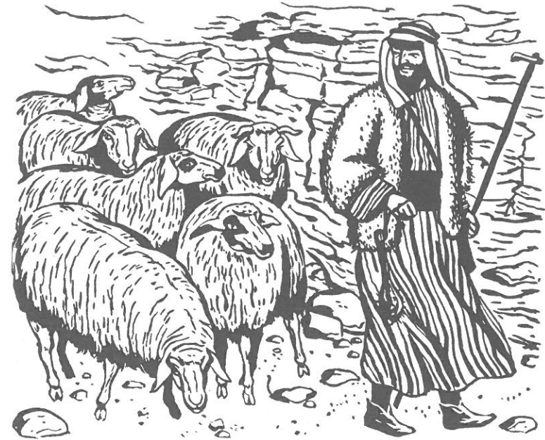
Pasterz wiodący stado

Stałe owczarnie buduje się zazwyczaj w dolinach albo na słonecznych stokach wzgórz, w miejscach osłoniętych przed zimnym wiatrem. Jest to niski budynek z łukowatymi wejściami, połączony z zagrodą. Podczas dobrej pogody zwierzęta tylko nocują w zagrodzie, jednak podczas