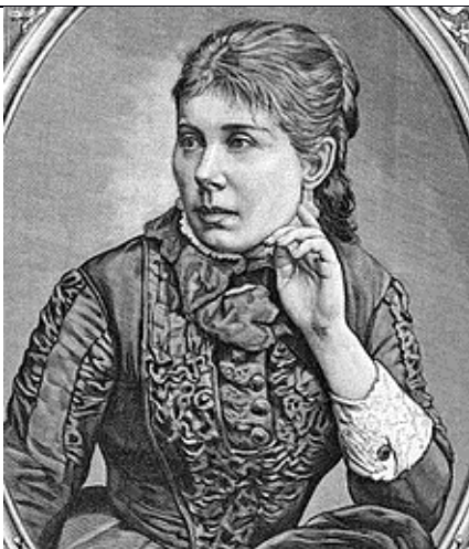
1 Maria Konopnicka

Podpisz zamieszczone zdjęcia, podając imię i nazwisko przedstawionej osoby: