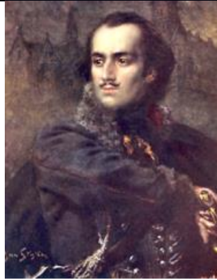
2. Kazimierz Pułaski