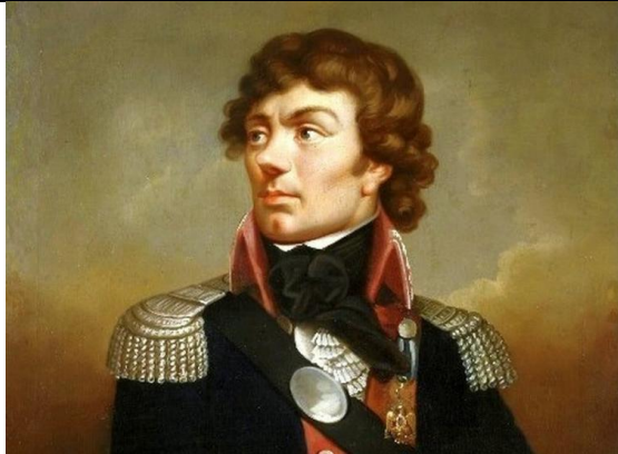
1. Tadeusz Kościuszko

Podpisz zamieszczone poniżej zdjęcia podając imię i nazwisko przedstawionej osoby: