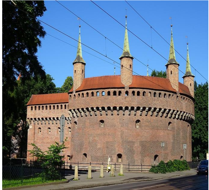
2 gotyk/styl gotycki