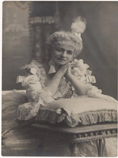
3 Helena Modrzejewska