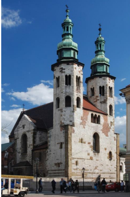
1 romanizm/styl romański

Podaj w jakim stylu architektonicznym zostały zbudowane zamieszczone na ilustracjach budowle: