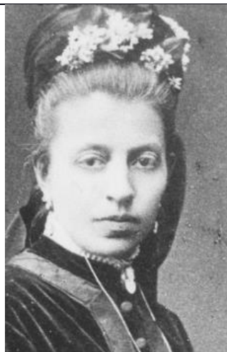
2 Eliza Orzeszkowa