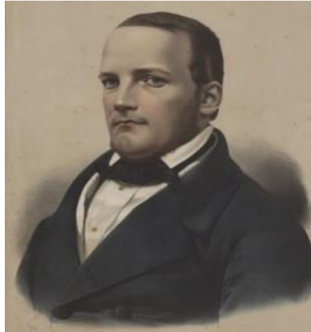
4 Stanisław Moniuszko