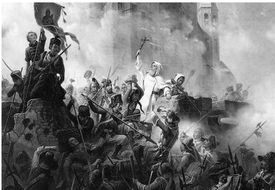
Januariusz Suchodolski. Obrona Jasnej Góry (obraz z 1875 r.)

Na podstawie poniższych źródeł i wiedzy pozaźródłowej odpowiedz na pytania.