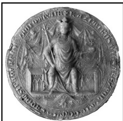
Pieczęć majestatyczna Kazimierza Wielkiego z 1336 r.